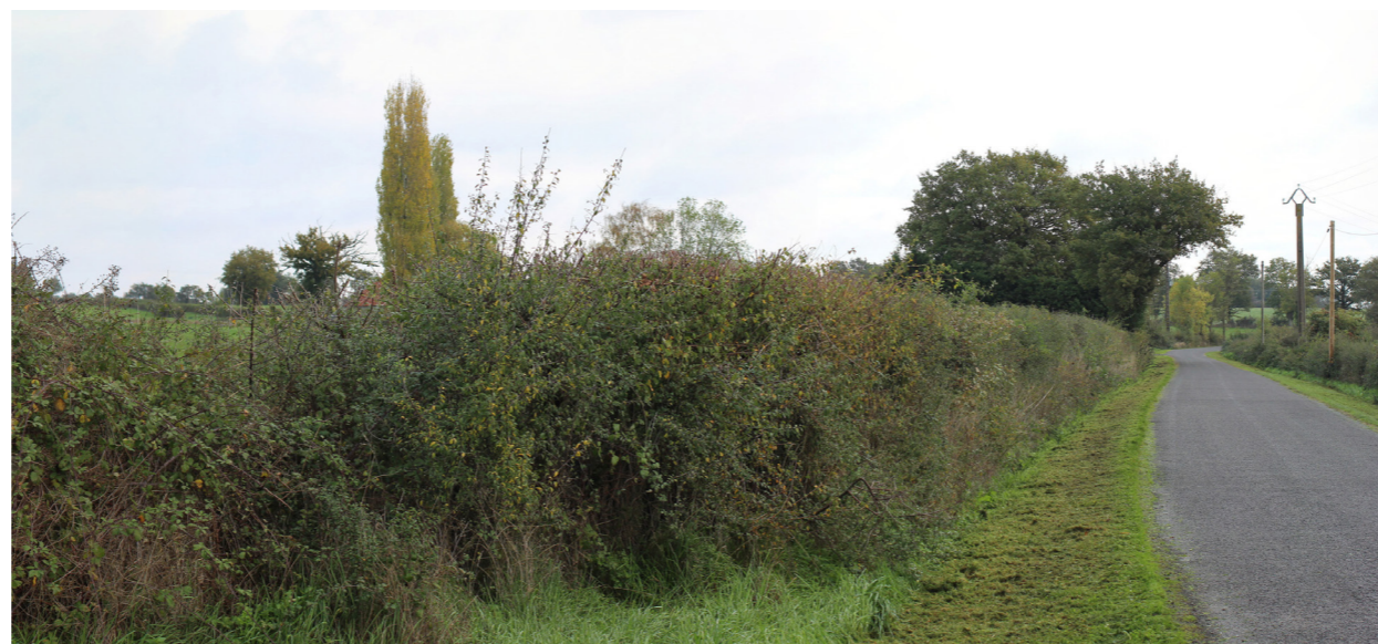
Photographie de l'état initial à 50°